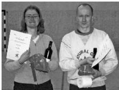
Sieger: "Die Kufenschleifer"