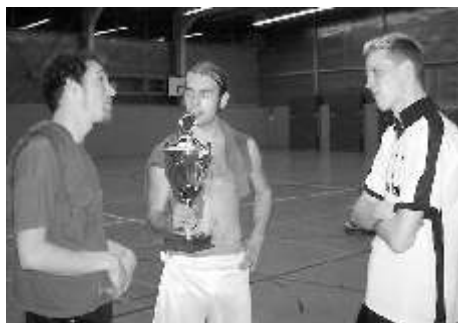
Kleiner Plausch nach dem Finale

Gleichwohl hatte der Samariter-Cup 2006 in den Running Assholes und Mandapam zwei würdige Finalisten, die sich gegenseitig ein mitreißendes und auch technisch hochwertiges Endspiel abforderten. Mit zwei Toren in Rückstand geraten riss Mandapam das Spiel noch herum. 3:2 stand es kurz vor Ende der regulären Spielzeit, bevor die Assholes einmal mehr in gewohnter Manier doch noch egalisierten. Zum ersten Mal in der noch jungen Geschichte des Samariter-Cups musste nun ein Golden Goal über den Turniersieg entscheiden. Den Running Assholes, die sich mit einer Verbandsliga-Spielerin verstärkt hatten, gelang dieser Triumph mit dem viel umjubelten 4:3-Endstand.