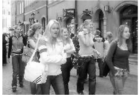
Beim Stadtbummel durch Warschau

Am Turnier nahmen drei Mannschaften unseres Jahrgangs und zwei Mannschaften der 2. polnischen Damenliga teil. Daraus resultierten am Ende zwei Wertungen. Unter den drei Mädchen-Mannschaften setzte sich EBT mit 4:0 Punkten und 31:25 Toren vor Plock mit 2:2/26:32 und Wilanowia mit 0:4/23:25 durch. Und auch im Turnier aller fünf Rivalen erreichten wir einen erstklassigen 2. Platz dank dem besseren Torverhältnis vor zwei punktgleichen Rivalen.