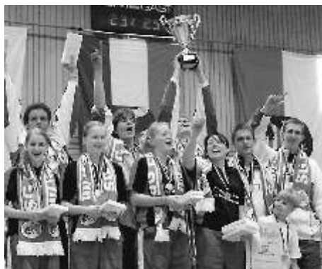
Deutscher Mannschaftsmeister U19 2006