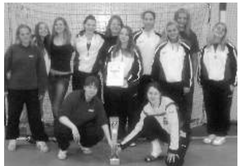
Die erfolgreichen EBT-Mädchen

Vom 20. bis 23. April war wiederum die weibliche B-Jugend Gast des Schulsportverbandes Warschau. Das Sporthotel mit Spielhalle, Schwimmbad und erstklassiger Verpflegung wurde allen Anforderungen gerecht. Vor dem Turnierbeginn machten wir zudem einen Ausflug in ein großes Thermalbad, wo die Mädchen sich nach Herzenslust austoben konnten.