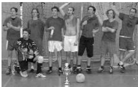
So sehen Champions aus: 2-facher Turniersieger Running Assholes